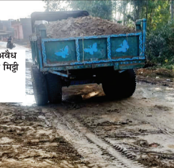
रम्नवाला में अवैध रूप से चल रहा मिट्टी खनन।

नजीबाबाद (चिंगारी)। क्षेत्र के कुछ खनन माफिया को पुलिस प्रशासन का खौफ नहीं है। मिट्टी खनन के पट्टों की आड़ में कई स्थानों पर अवैध खनन का खेल जारी है। नजीबाबाद तहसील के ग्राम किशोरपुरा उर्फ रम्नवाला में मिट्टी खनन के पट्टे की आड़ में कुछ लोग रातों-रात बड़े पैमाने पर मिट्टी के अवैध खनन का धंधा चला रहे हैं। मिट्टी खनन माफिया क्षेत्र में खुले आम अवैध रूप से मिट्टी खनन का काम कर रहे हैं। खनन माफिया पट्टे के खनन का काम दिन में तथा पट्टे की आड़ में होना वाला मिट्टी खनन का काम रात के अंधेरे में करते हैं। जिससे किसी को पता न चल पाए। डीएम का रात में किसी तरह के भी खनन कार्य पर रोक है। इसके बावजूद खनन माफिया इस तरह से अवैध मिट्टी खनन का कार्य कर डीएम व एसडीएम के आदेश की खुले आम धज्जियां उड़ा रहे हैं। बड़े पैमाने पर अवैध मिट्टी खनन से राजस्व की चोरी हो रही है।