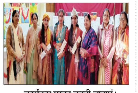
कार्यक्रम प्रस्तुत करती छात्राएं।