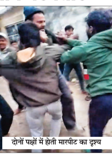
दोनों पक्षों में होती मारपीट का दृश्य

नांगल सोती (चिंगारी)। गुरुवार शाम ग्राम सौफतपुर में मामूली बात को लेकर दो पक्षों के बीच मारपीट हो गई। घटना का वीडियो सोशल मीडिया पर वायरल हो गया। दोनों पक्ष अलग-अलग साम्प्रदायिक रंग देने के कारण कुछ लोगों द्वारा मामले को साम्प्रदायिक रंग देने का प्रयास किया गया। पुलिस ने मुकदमा दर्ज कर आरोपियों को गिरफ्तार कर लिया है।