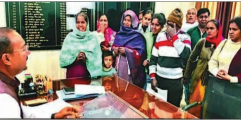
एसडीएम से न्याय की गुहार लगाते पीड़ित ग्रामीण।