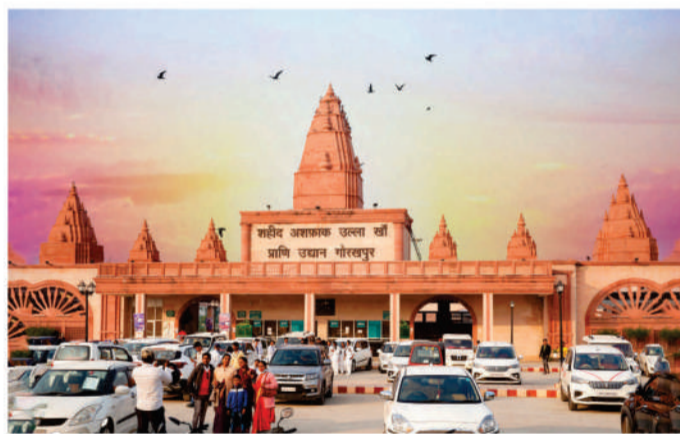
शहीद अशफाक उल्ला खां प्राणी उद्यान गोरखपुर