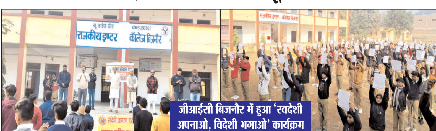
जीआईसी बिजनौर में हुआ 'स्वदेशी अपनाओ, विदेशी भगाओ' कार्यक्रम